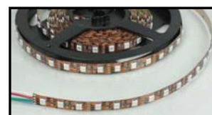
60 LED/m RGB